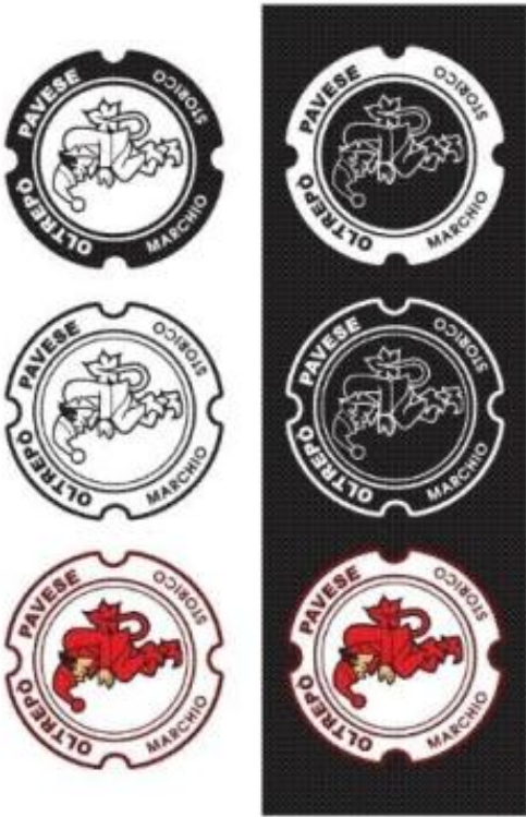
A colori su nero