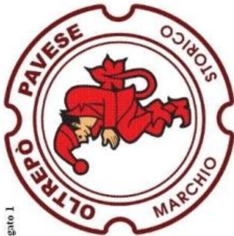
Presentazione marchio e sue applicazioni